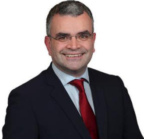
Dara Mac Giolla Laoire, TD

An tAire um Chur Chun Cinn Trádála, Claochlú Digiteach agus Rialáil Cuideachtaí