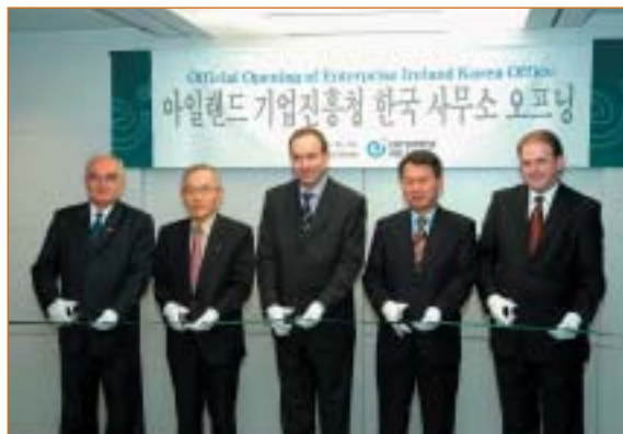
Micheál Martin T.D., An tAire Fiontar, Trádála agus Fostaíochta ag oscailt oifigiúil Oifig Chóiré de chuid Fhiontraíocht Éireann.

Chuir Fiontraíocht Éireann os cionn 9,000 cliant agus ceannaitheoir in aithne dá chéile le linn 2004. Tionóladh 21 aonach trádála chomh maith, rud a d'éascaigh deiseanna nua margaidh do 199 cliant. Chuidigh na gníomhaíochtaí seo le bunú os cionn 800 beart idir custaiméirí, imdháileoírí agus comhpháirtithe.