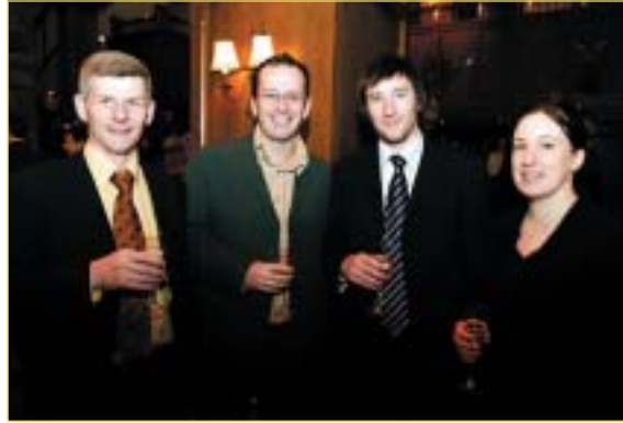
Foireann na Roinne ag bronnadh na nduaiseanna sa chomórtas "Best Companies to Work For in Ireland"

Liostáladh an Roinn Fiontar, Trádála agus Fostaíochta ar cheann den 50 eagraíocht is fearr in Éirinn feidhmí ann mar fhostaí i 2004. Is cuid de thionscnamh ag an gCoimisiún Eorpach é an comórtas "Na Comhlachtaí is Fearr in Éirinn a bheith ag Obair leo" chun aird a tharraingt ar na láithreacha oibre is forásaí ar fud na hEorpa, sna hearnálacha poiblí agus príobháideacha araon. Leis an tionscnamh seo is í aidhm an Choimisiúin ná caighdeán na láithreacha oibre ar fud na hEorpa a ardú trí iomaíocht shláintiúil a spreagadh i measc eagraíochtaí agus iad ag súil le bheith i measc na láithreacha oibre is fearr ina dtír féin agus san Eoraip.