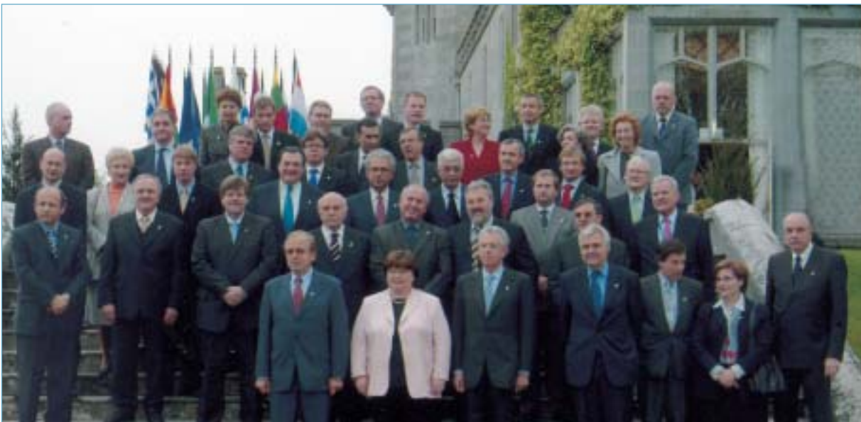
An Tánaiste, Mary Harney T.D. & comhghleacaithe ag Cruinniú Chomhairle Iomaíochais an AE, Caisleán Dromoland