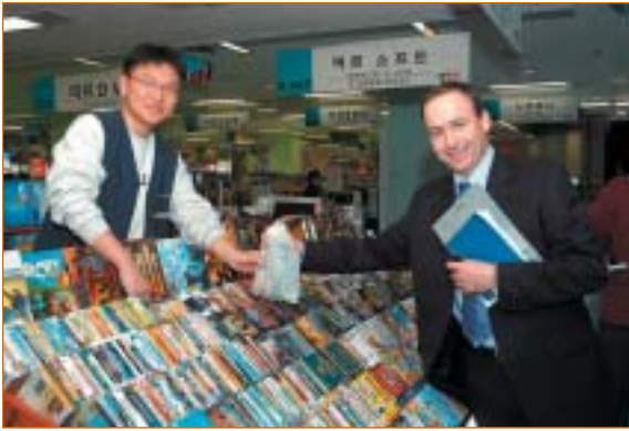
Micheál Martin TD, An tAire Fiontar, Trádála agus Fostaíochta ag tabhairt cuairte ar Technomart le linn misean trádála chun na Seapáine agus na Cóiré i mí na Samhna 2004.

I rith na bliana críochnaíodh an obair ar athbhreithniú agus ar athfhoirmlíú Straitéis na hÁise don tréimhse 2005-2009.