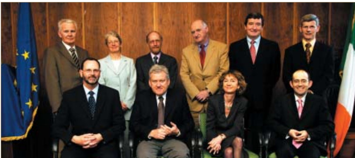
Bord Bainistíochta na Roinne