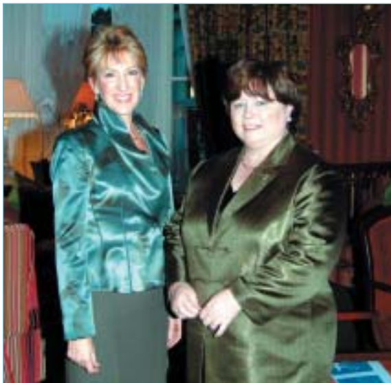
An Tánaiste, Mary Harney T.D. & Carly Fiorina, Cathaoirleach & Príomhfheidhmeannach ar Hewlett-Packard ag Cruinniú Chomhairle Iomaíochais an AE, Caisleán Dromoland

Bhí Uachtaránacht na hÉireann ar an Aontas Eorpach ina fhócas lárnach d'obair na Roinne sa chéad leath de 2004. Bhí baint dhíreach ag an Roinn le hobair thrí chinn de naoi fhoirmíocht Chomhairle na nAirí, is iad sin an Chomhairle Iomaíochais; An Chomhairle Fostaíochta, Polasaí Sóisialta, Sláinte agus Gnóthaí Tomhaltóirí; agus an Chomhairle Gnóthaí Ginearálta agus Caidrimh Sheachtracha, maidir le gnóthaí trádála.